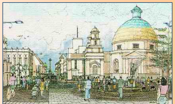
SEMARANG HISTORIC AREA CONSERVATION MANAGEMENT ASSISTANCE